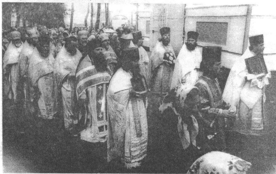
Крестный ход вокруг Храма во время посещения Архиепископом Мелхиседеком прихода