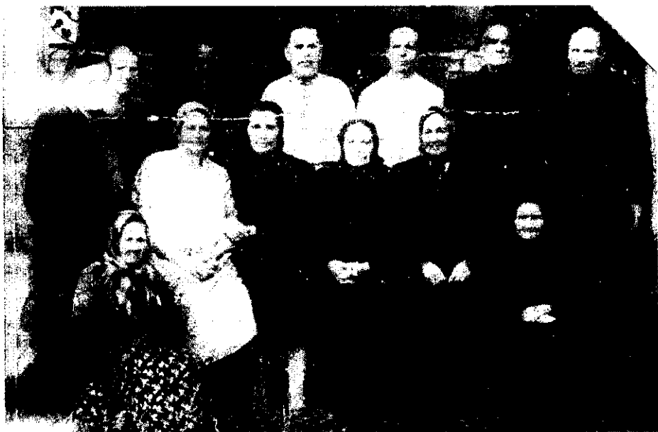
Церковный хор. 1957 год