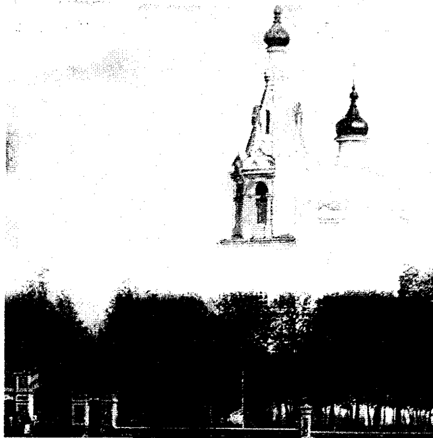
Чудо-Михайловская церковь в 1905 году...