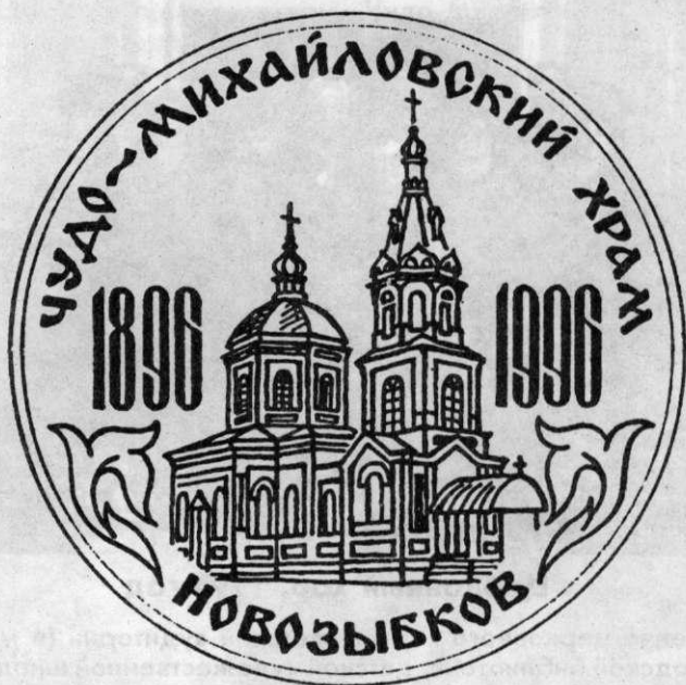
Юбилейная медаль, выпущенная к 100-летию Чудо-Михайловского Храма