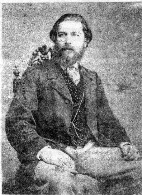
Михаил Уманец

Строительство Храма продолжалось 31 год и было закончено в 1898 году. Однако его освящение состоялось раньше — 16 февраля 1896 года, на котором присутствовало 12 священников.