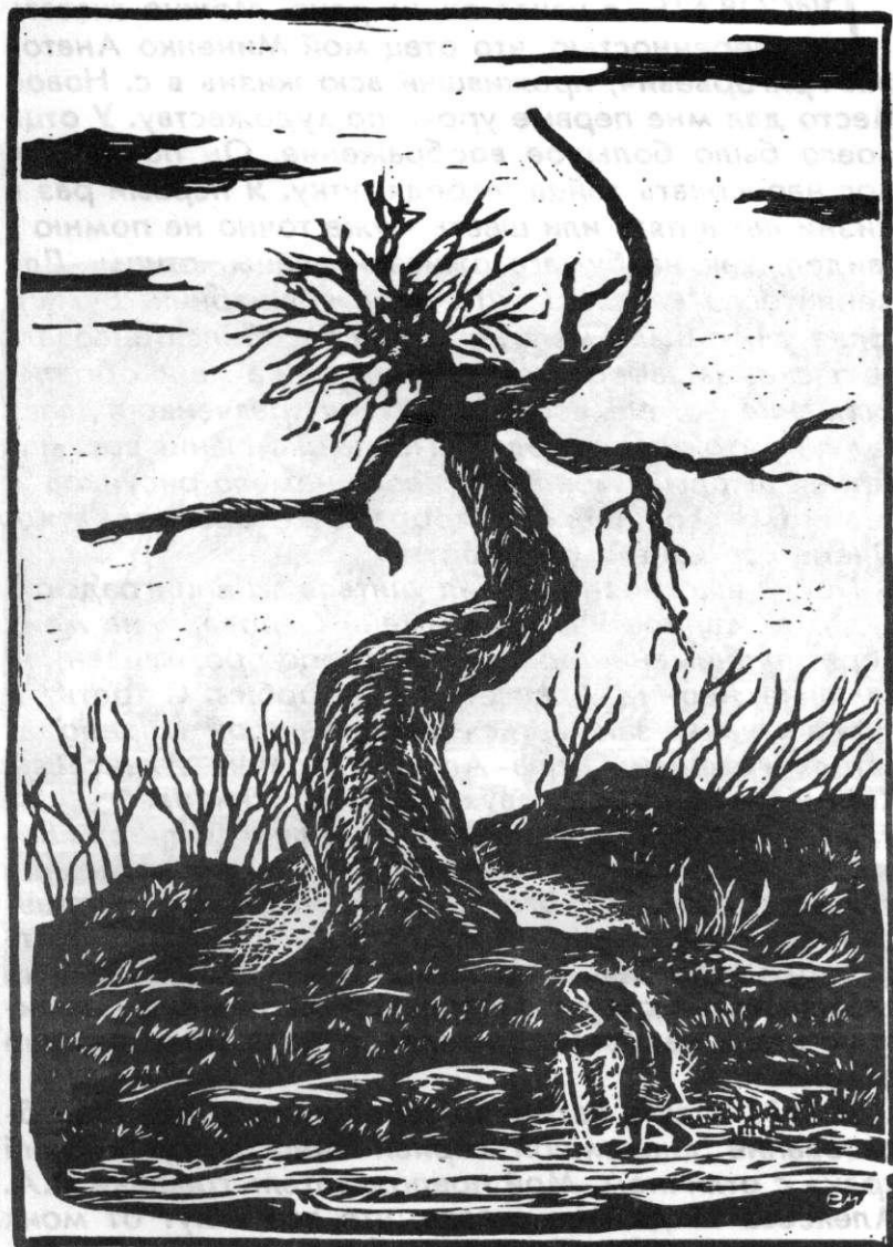
«В ДОРОГЕ» 1990 г.