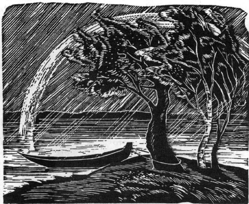
«ПОСЛЕ ГРОЗЫ» 1976 г.