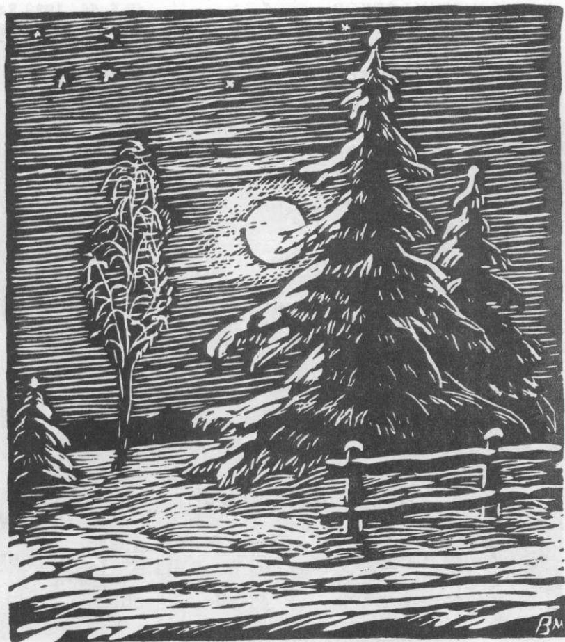
«ЛУННАЯ НОЧЬ» 1986 г.