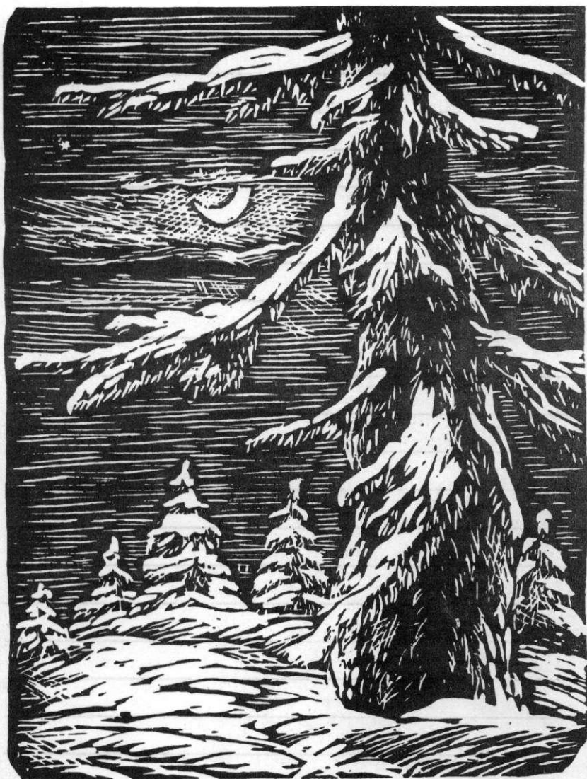
«СТАРОЕ ДЕРЕВО» 1987 г.