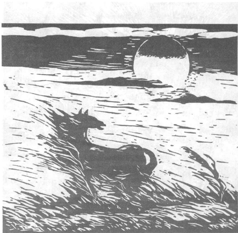
«ВЕТЕР» 1986 г.