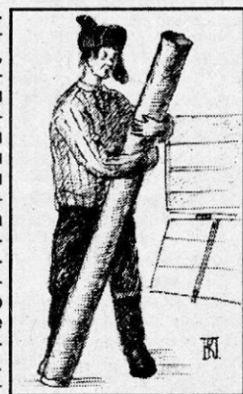
Рис. К. Попова.

Леонид ЩЕМЕЛЕВ Приходилось вам когда наступить на кочергу? Нет? Не знали вы тогда Стужи зимней и пургу. Не топились вы дровами И, прикрывшись кожушком, При копилке вечерами Чай не пили с сухарьком. С посившими носами Не сидели на лежанке, И с пустыми животами Не таскали с леса санки.