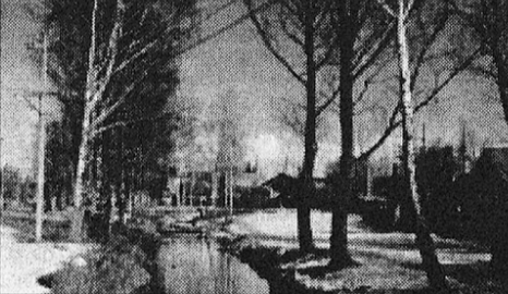
«ВЕСНА В НОВОЗЫБКОВЕ».

Проходит ночь и меркнут грезы, И гаснут звезды надо мной, И на столе поникли розы, Уже не слышен голос твой.