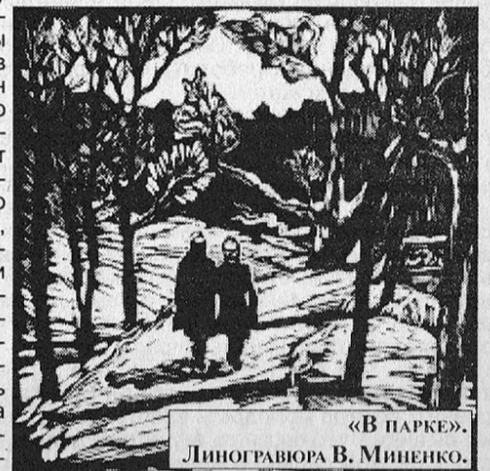
«В ПАРКЕ». ЛИНОГРАФИРА В. МИШЕНКО.

Но мне часто снится один и тот же сон: я пару как птица над землей и вижу - пятнадцать вагонов красивой змейкой мчатся по точеным рельсам и впереди сверкающий локомотив и точное расписание светлого будущего.