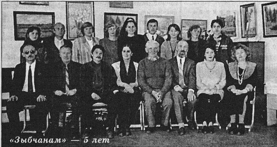
«Зыбчанам» — 5 лет