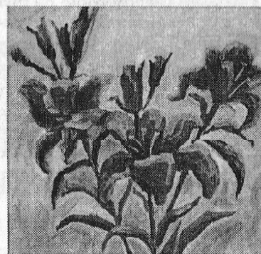
«ЛИЛИИ». Художник Мария КОРНЮХОВА.

На сером небосклоне громада туч, И синева, бессильная сиять, Не отражаясь в глубине озёрной, Мгновенно вытекла дождём На летний луг. Нечаянно упавший луч, Как с неба проскользнувшая змея, Рассыпался на сто жемчужных зёрен И в каждой капелке огнём Зажегся вдрог. Так нам, как слух – глухому, А незрячий – зренью, Больному – избавление от мук, Даруется внезапно вдохновенье.