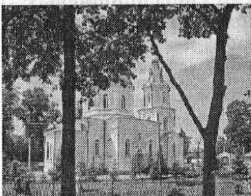
«НА ТРОИЦУ».

*** Рисую солнце на бумаге, Рисую желтίζουν полей, Рисую реки и овраги, Рисую город без людей. Замученные и замороченные Глядят они через окно. Стал срок ареста их бессрочен, Рабочий день был так давно. А тут ещё на месяц дома Без баров, аэродромов, Без бизнеса и без продаж... Но будущее – не мираж. Где правда стало непонятно, Никто не объясняет внятно. И снова лгут и привирают, Зачем им это, кто их знает?.. Рисую вирус на бумаге, Рисую черноту ночей, Рисую мусорные баки, Рисую маски для людей.