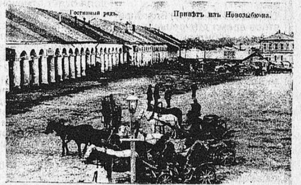
НОВОЗЫБКОВ. ГОСТИНЫЙ РЯД 1913 г.