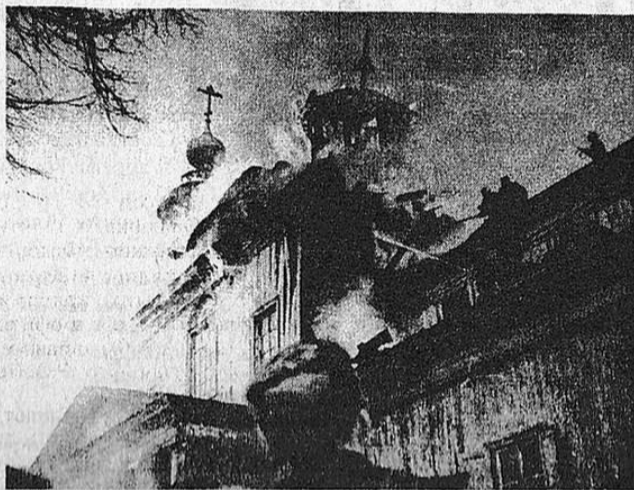
ГОРИТ КУПОЛ НИКОЛЬСКОЙ ЦЕРКВИ 1959 г.

Свистят залетающие за церковную ограду шайбы между крестов знатным и почетным людям города, похороненным здесь. Постоянно на их могилы приземляются и футбольные мячи, тревожат их покой и неуравновешенные болельщики. Воистину не ведаем, что творим, а потом сетуем на безнравственность подрастающего поколения, берущего с нас пример. Планируемый с 70-х годов перенос стадиона в конец улицы Коммунистической так и остался нереализо-