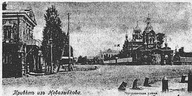
Привет из Новозыбкова.