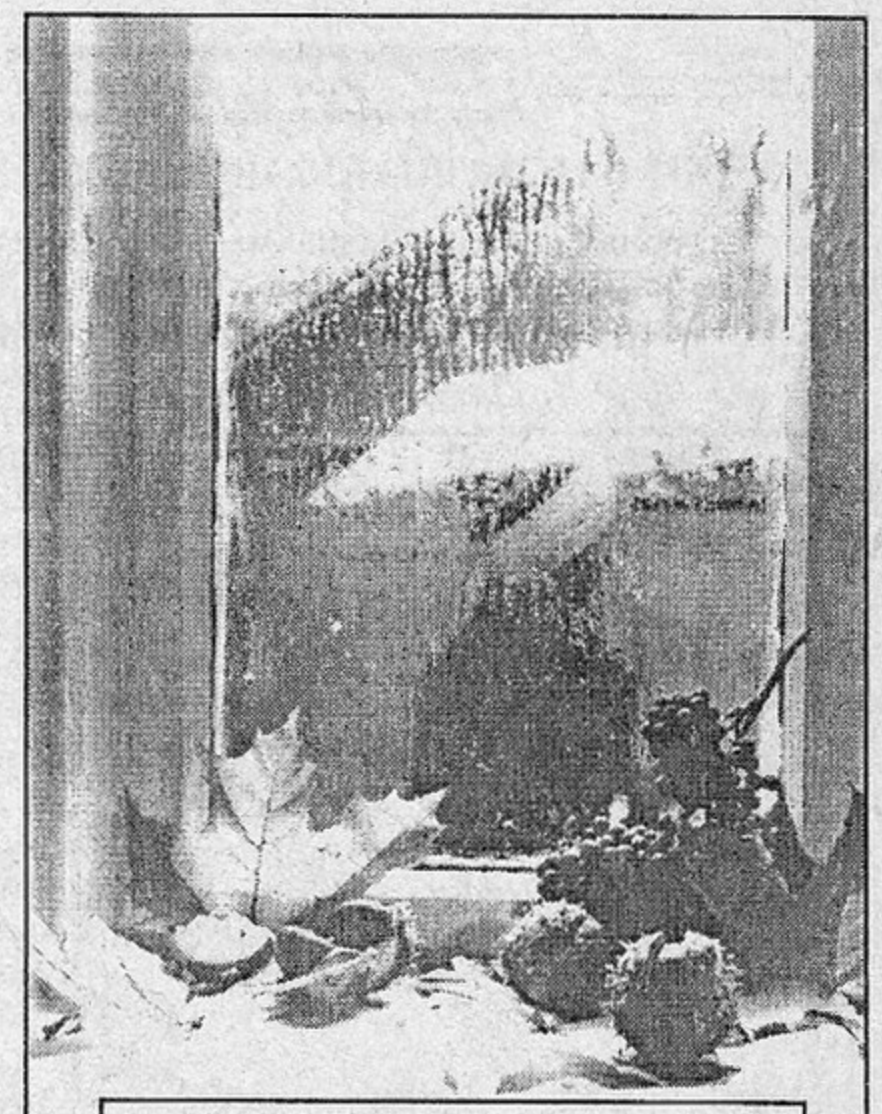
"Осенний натюрморт"

А наутро - деревья в снегу, Неба синь в позолоте восхода. В красоте несказанной природа Я ее для себя сберегу.