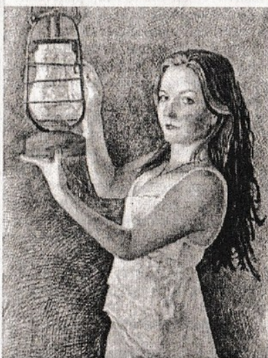
Худ. Виталий ДАНИЛЬЧУК. “Ольга”.

Буду любоваться грустной порой, Бабочкой порхающей осени... зимой.