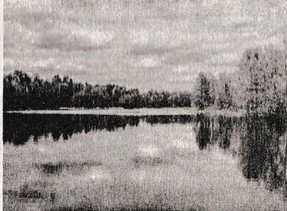
“У озера”.

– Давайте я помогу вам сойти на берег, – погромче сказала я, подумав, что они плохо слышат, – лодка может перевернуться. Вы что, не боитесь утонуть?