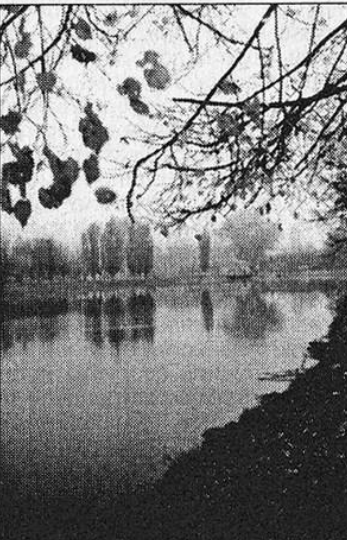
«Падают листья». Фототюд И. Барсукова.

Пусть небо тучами закроет, Пусть увядание пришло, Надежду нам терять не стоит, – Не навсегда тепло ушло.