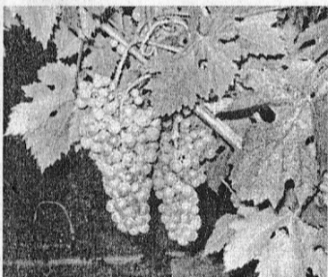
«ГРОЗДЬЯ ВИНОГРАДА». Фотоэтиюд Ларисы ШПАКОВОЙ.

СОМНЕНИЯ Сомнения стаей птиц кружат, О сложном или о простом Заговорят, узор из кружев Словес развесив надо мной, и сто Моих разуверений По-птичьи ловко расклюют. И жар мгновенных откровений, И пыл надежд, и слов уют – Растреплют всё. И станет ясно, Что мир отчаянно устал, Что в нём звучал, увы, напрасно Любви торжественный хорал. Покажется: всё онемело, И немоте той нет границ. И то и дело, то и дело Слышны в нём крики Новых птиц.