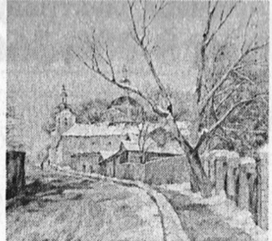
Художник Михаил НЕХАЙЧИК. «ВЕСЕННЕЕ СОЛНЦЕ».

*** ХОЛОДНАЯ ВЕСНА Холодное цветение садов не веселит, Когда, листвою окутываясь тонко, Робеет май, не понимая толком. На что так ветер северный сердит. А синева в полднейный даже час Сквозит, почти не тронутая солнцем. Так свет нежаркий равнодушно льётся Из навсегда любви лишённых глаз. Подумаешь: чураясь суеты, Как будто всё ей наперёд известно. Усталая, озябшая невеста Печально смотрит на гостей из-под фаты.