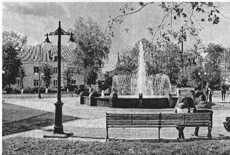
«У фонтана».

Она достала пакет с кипой бумажных иконок со