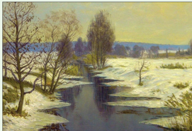
Художник Дмитрий ПУПАНОВ. "Конец зимы".

На базаре, в сторонке, Где старушки сидят, Продают всё, что нужно, Всё, что можно продать. Выбирает, торгует И толпится народ, У одной лишь старушки Ничего не берёт. Разложила на тряпке Всё богатство своё, Ни к чему оно стало, Жизнь прошла всё равно. Кофта, брюки, платок Шерстяной и носки... Но блеснуло на солнце Что-то там, внутри. Весь увешанный к ряду В орденах пиджачок: Видно дед был героем И оставил, что мог... Жизнь он прожил с женою, Было легче вдвоём, Не решалась старушка Продавать всё при нём. И сейчас не посмела Продавать ордена... Завернула обратно, Вскоре с рынка ушла. А теперь он в музее: Тот пиджак под стеклом. Пусть земля будет пухом Всем, кто спит вечным сном. Слава всем патриотам, Всем героям войны. Ордена и медали — Это гордость Страны!