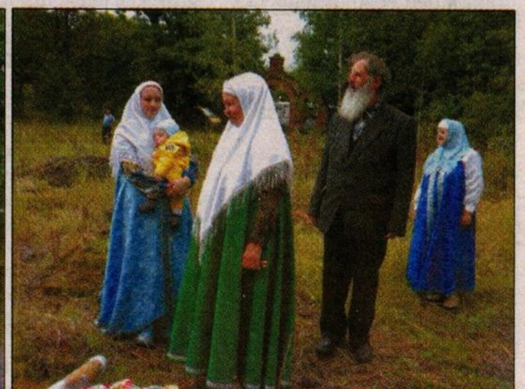
Старообрядцы из Клинцов.