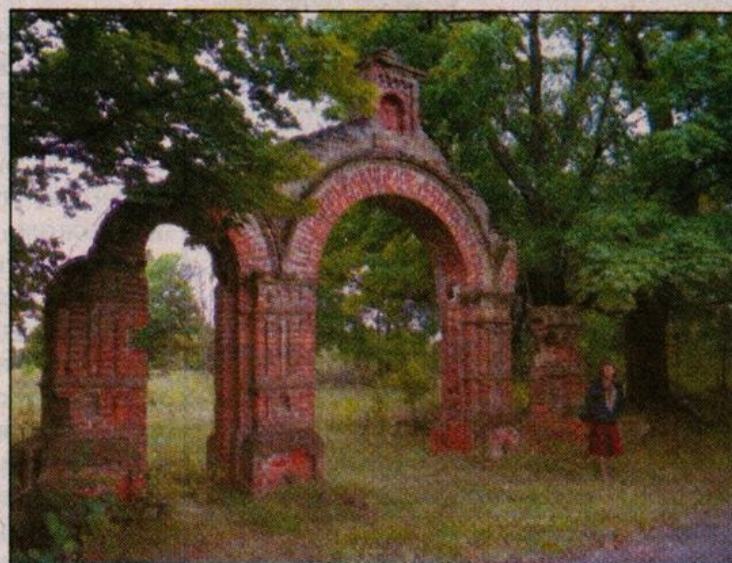
Ворота бывшего храма.