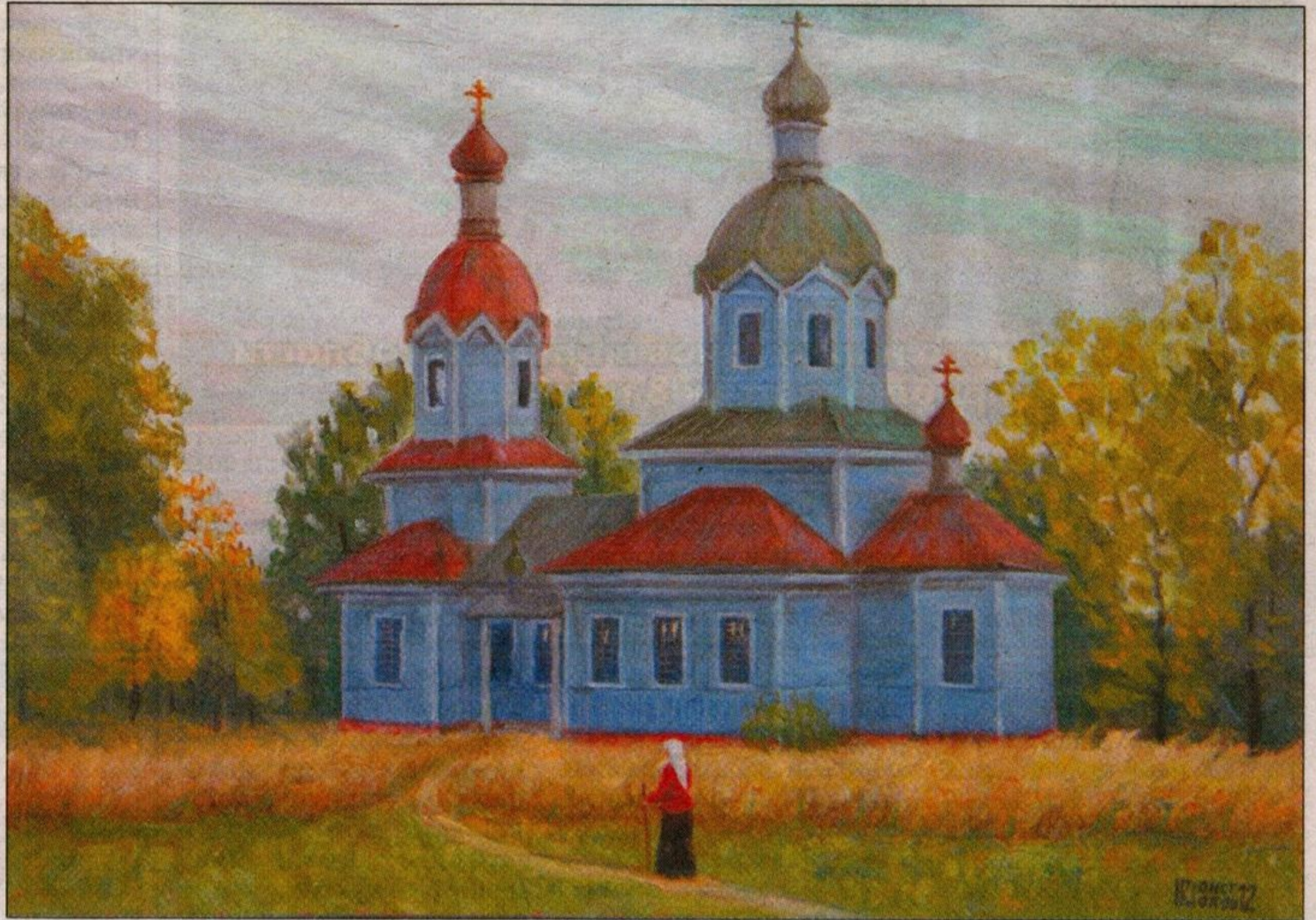
Репродукция К. Попова «Тропинка к храму».