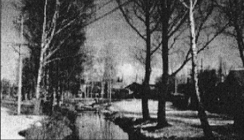
«ВЕСНА В НОВОЗЫБКОВЕ».

Проходит ночь и меркнут грезы, И гаснут звезды надо мной, И на столе поникли розы, Уже не слышен голос твой.