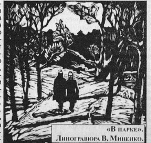
«В ПАРКЕ». Линогравюра В. Мищенко.

Я решила вернуться в вагон моего детства, тем более там находились мои дочь и внучка. Не буду описывать свои трудности по этому поводу, но я вернулась. И вот мы вместе, и мы в пути. Наш вагон повез нас по жизни. Он обветшал, идет гремя и покачиваясь, то и дело останавливаясь, не имея твердого расписания и верного направления; в нем порою бывает холодно и голодно, а стоимость проезда стала высокой и продолжает повышаться.