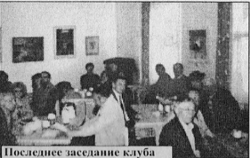
Последнее заседание клуба на ул. Рокоссовского.

Все это наложило отпечаток на деятельность клуба в преддверии 300-летнего юбилея города, заставив свернуть многие из намеченных планов. Не удалось организовать, например, выставку, посвященную