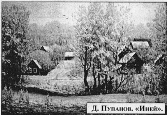
Д. Пупанов. «Иней».

Но в глубине души - живут воспоминанья, Наперекор всему, наперекор себе. Любовь моя жива, не нужно сострадания! Все мысли о тебе, и только о тебе!