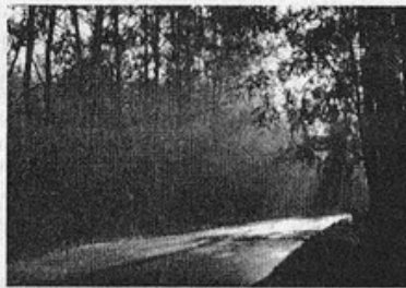
"Утро в лесу".

В начале было Слово И азбука Христова, Потом из букв, слогов Сложилась цепь веков. Кто знал, а кто не ведал За солнцем или снегом, Чтоб вечно мир был новым, Сказал Учитель Слово.