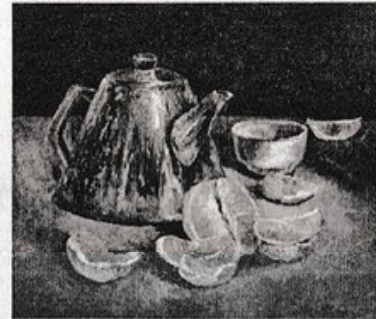
Худ. Е. Целобанова. "Натюрморт".

Она нагрянула жестоко и нежданно, И черной тенью на душу легла Не новостью газетной иль экранной, А вот она живая, как змея. Беда — проверка каждого на прочность: Один раскис — и свет уже не мил. Другой — пружина, красота и точность — Чуть-чуть поддавшись, плечи распрямил!