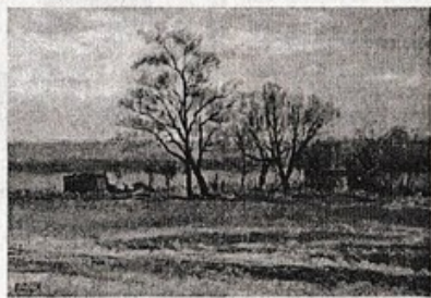
Худ. К. Попов. "На околице".

— Нет-нет! Строители — первые гости. Но всех опередил соседский мальчишка, незаметно прокраившийся к двери. Протиснувшись между взрослыми, он юркнул в коридор и пустил через порог котёнка, который от страха жалобно замыкал. Все засмеялись и, толкая друг друга, протиснулись в ещё пустой дом. По размерам он был не больше старого, но потолок поднялся выше, окна шире, и весь он получился уютный, красивый и очень родной. Мы откровенно любовались своим детищем. Сколько сил и умения в него вложено! Сколько ему отдано свободного времени — выходных и отпусков! И вот он стоит, и будет стоять, независимо от того, какая судьба ожидает его строителей. Я с волнением смотрела на тех, с кем ещё недавно работала и видела: дом построен не только на земле, но мы возродились сами, дом построен у нас в душе, и это навсегда. Я была уверена — такие люди не слухавят, не подведут и не предадут.