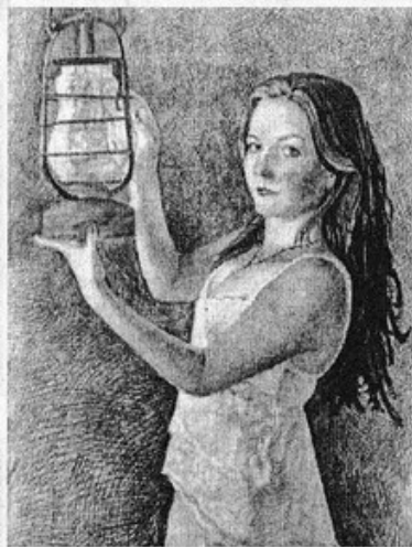
Худ. Виталий ДАНИЛЬЧУК. "Ольга".

Буду любоваться грустной порой, Бабочкой порхающей осени... зимой.