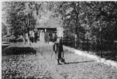
"Осень в городе".

ЯНВАРЬ СКУПЫМ БЫЛ НА СНЕГА Январь скупым был на снега, Не часто баловал морозом, И почерневшие стога В полях стоят немым вопросом. Да, полно, разве то зима? С тоской шемящей дуют ветры, А где метелей кутерьма, Атласов белых километры? Где снег, искрящийся в лучах, Пар изо рта и щек румянец, И песни вьюги по ночам, Озер замерзших твердый глянец. Два месяца мы зиму ждем, Она, как перед ЗАГСом, медлит, Уж скоро мартовским дождем Услышим и капелей лепет!