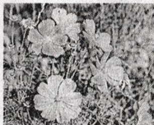
«ЛЕТНИЕ ЦВЕТЫ».

Уходило лето, уходило... Звонкой каплей стукнуло в окно, На прощанье нежно подарил От лозы прозрачное вино. Звездопадом украшало небо, В дар несло Пречистой Рождество, Заставляло верить в быль и небыль, Верить в вечной жизни торжество!