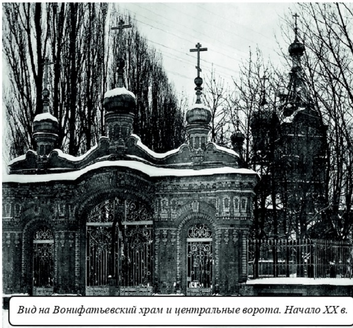
Вид на Вонифатьевский храм и центральные ворота. Начало XX в.

Выпускница Новозыбковской женской гимназии, стоявшая у истоков зарождения отечественного кино, Эсфирь Шуб (рожденная Рощаль), в 60-х годах прошлого столетия напишет: «Уроженка Черниговской губернии, я с тринадцати лет помню пылающие усадьбы помещиков. Вместе с народом, борющимся за свободу, мы ненавидим кровавый режим самодержавия, царя, его министров, господствующие эксплуататорские классы, аристократию, помещиков, буржуазию, либеральную партию кадетов. ...Мы жадно ловим все, что говорит о распаде этого гнойника, о подпольных революционных организациях, о ширящемся революционном сознании и сопротивлении рабочих и крестьян».