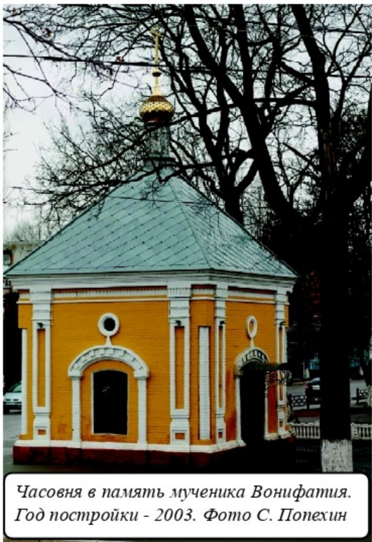
Часовня в память мученика Вонифатия. Год постройки - 2003.