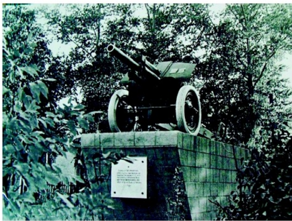
Пушка Смолякова, установленная на месте алтарной части храма. 1968 год.

ся его лицу. Да, жизнь «проехала» по нем. Рассказывали, как он после возвращения из лагерей пригоршнями сгребал прах, то, что осталось от захоронения родителей после разрушения склепа, горе свое изливая по-французски. Люди из его скорбной речи поняли лишь одно слово – вандалы».